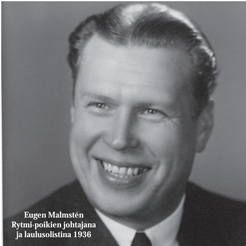
Eugen Malmstén Rytmi-poikien johtajana ja laulusolistina 1936